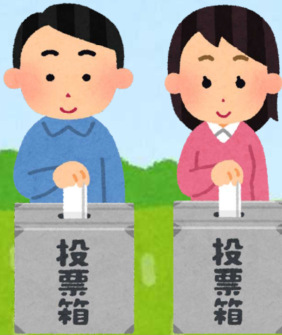
ちょう じん 町 民 さいいじょう (18才以上)