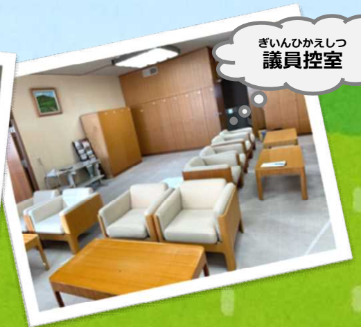
ぎいんひかえしつ 議員控室