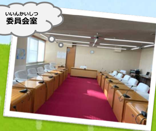
いいんかいしつ 委員会室