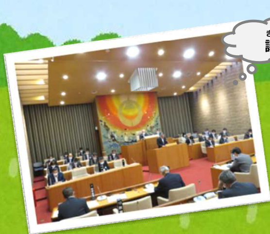
ぎ じょう 議 場

ほんかいぎ ぎじょう ちょうしゃ かい いいんかい いいんかいしつ ぎいんひかえしつ ちょうしゃ かい おこな 本会議は議場（庁舎3階）、委員会は委員会室か議員控室（庁舎3階）で行われます。